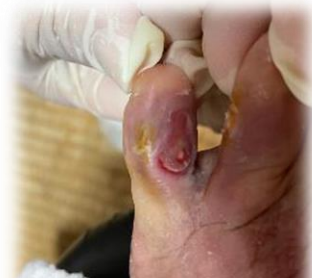
足の指の間：表皮剥離